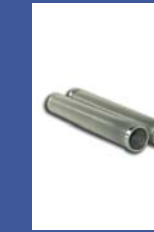
filters en zeven

...en ons programma lijmapparatuur voor de verpakingsindustrie