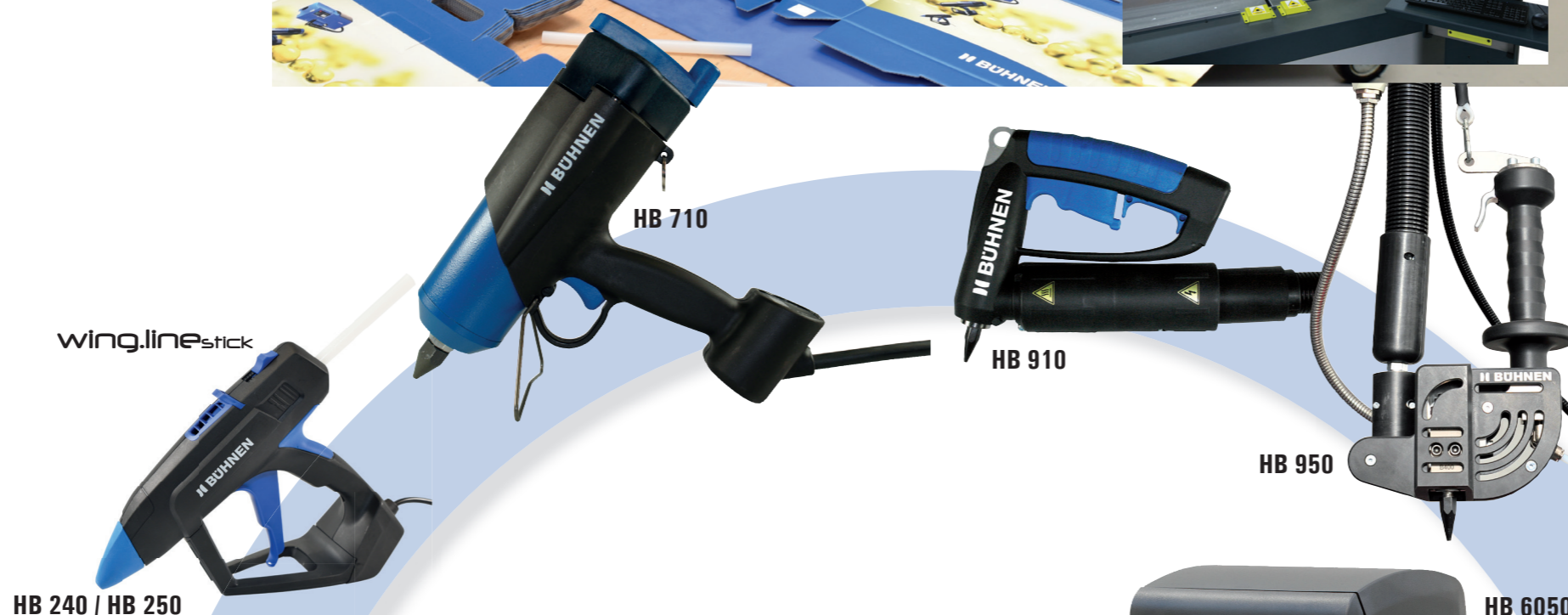
HB 240 / HB 250