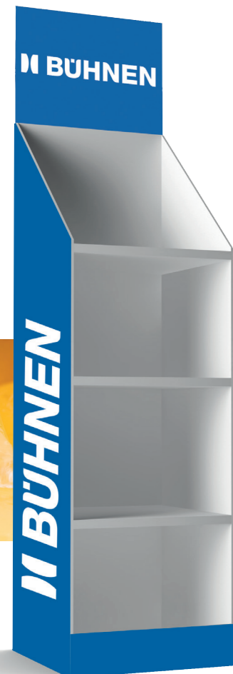
HB 240 / HB 250

Lassen Sie uns gemeinsam das für Sie geeignete System, bestehend aus Klebstoffen und Auftragsgeräten ermitteln. Fordern Sie uns und nehmen Sie heute noch Kontakt mit uns auf.