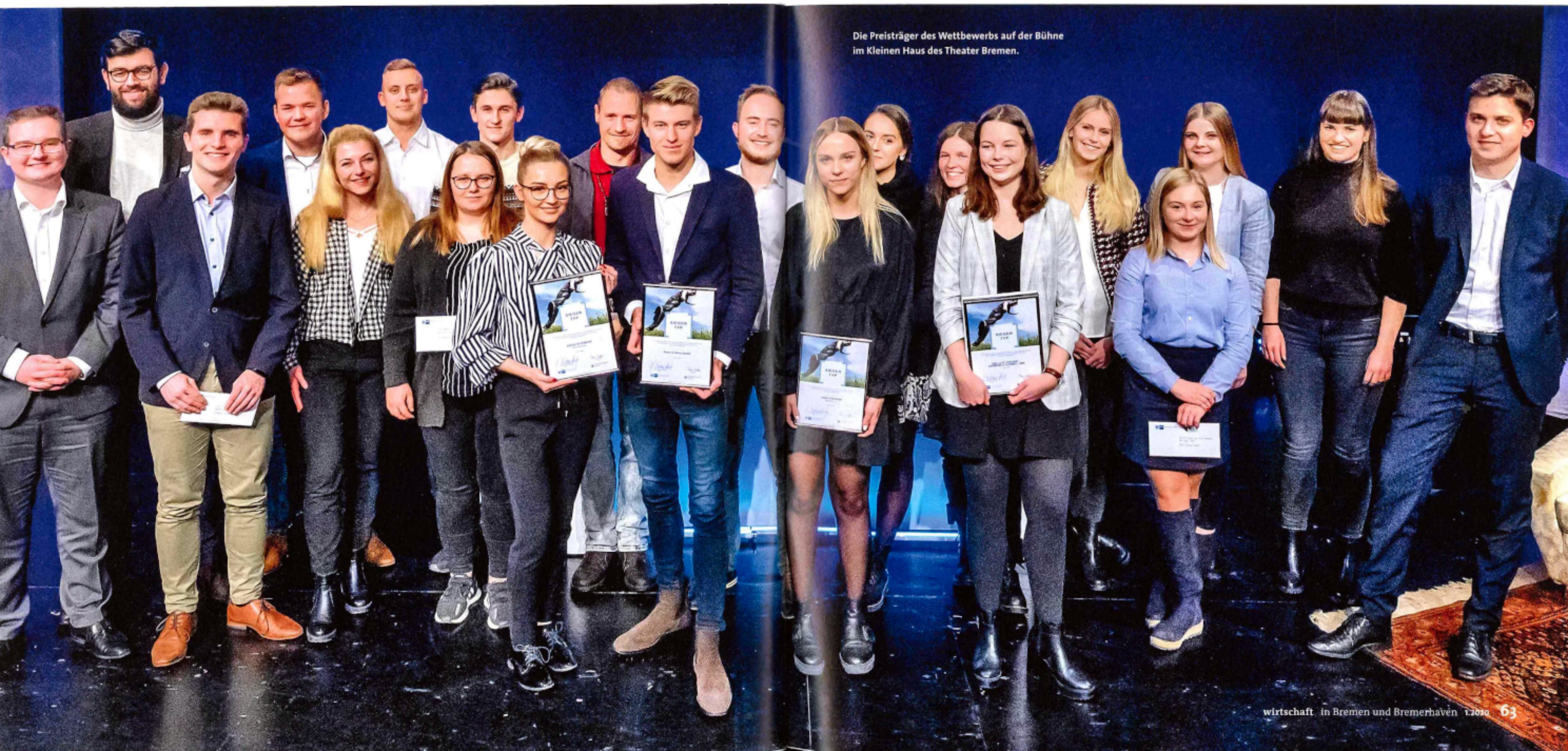
Die Preisträger des Wettbewerbs auf der Bühne im Kleinen Haus des Theater Bremen.

Von Nina Svensson (Text) und Frank Pusch (Bild)