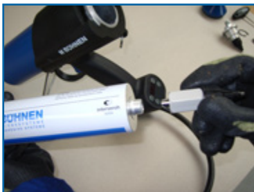
5. Düsenbausatz auf heiße Kartusche schrauben 5. Screw nozzle kit on hot cartridge