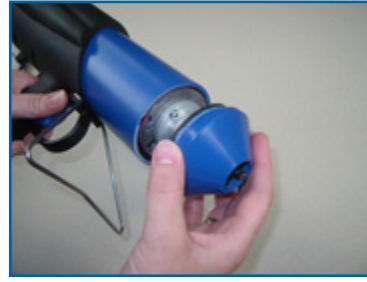
2. Demontage Kappe 2. Disassembling of cap