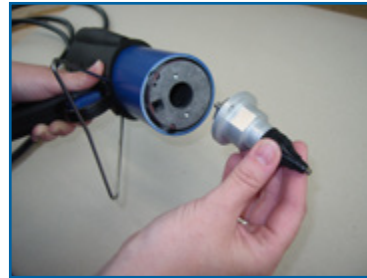
4. Demontage Düsenblock 4. Disassembling of nozzle block