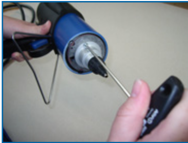
3. Demontage Schrauben 3. Disassembling of screws