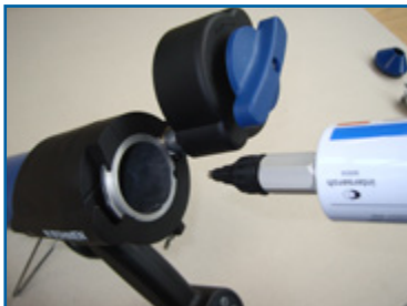
7. Kartusche mit Düsenbausatz in HB 700 einführen oder entnehmen 7. Insert or remove cartridge with nozzle kit in HB 700