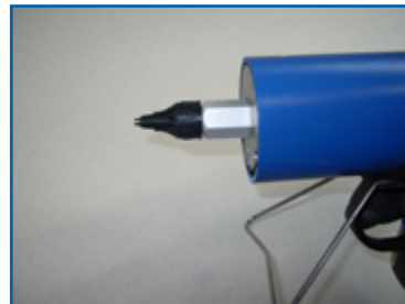
8. Deckel schließen. Schrauben, Sicherungsring, Kappe und Düsenblock aufbewahren. 8. Close lid. Keep safe screws, lockingring, cap and nozzle block.