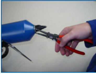
1. Demontage Sicherungsring 1. Disassembling of locking ring